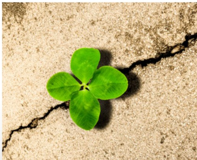
Bevoegd - Bekwaam - Geregistreerd

Talryk is/behoort tot de beste werkgevers in het Noordelijke (Speciaal) Onderwijs, zo staan wij bekend in de regio.